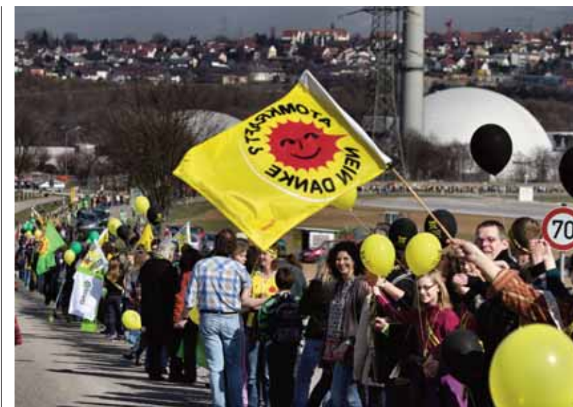
Die Mehrheit der Deutschen will den Ausstieg aus der Atomenergie. Menschenkette vor dem Kernkraftwerk Neckarwestheim