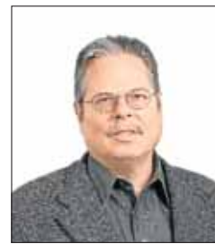
Leonberg Günter Roth (55) Richter am Landgericht Saarbrücken a.D.